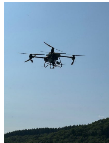
Sprühdrohne DJI Agras T50 im Demo-Einsatz in Ayl/Mosel